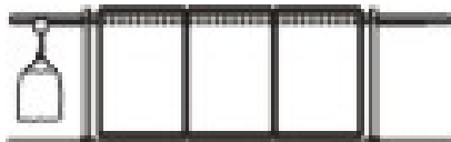
■ Via de grúa