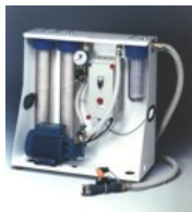
■ Tratamiento de agua AS 300